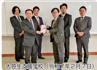
大笹生支援学校（令和7年2月7日）

校へお贈りして参りました。この活動は今後も続けて参りますので、「街で」「どこかの会場で」見かけましたら、ご協力どうぞよろしくお願いいたします。