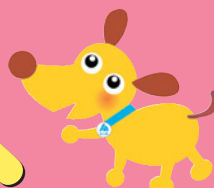
法人会キャラクター けんたくん