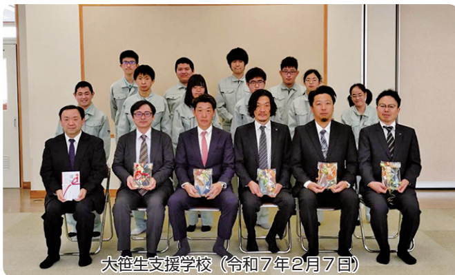
大笹生支援学校（令和7年2月7日）