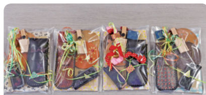
大笹生支援学校 記念品

今回も様々な事業において募金を呼びかけ、お預かりした金額は45万円ほどとなりました。これを大笹生、だての両支援学