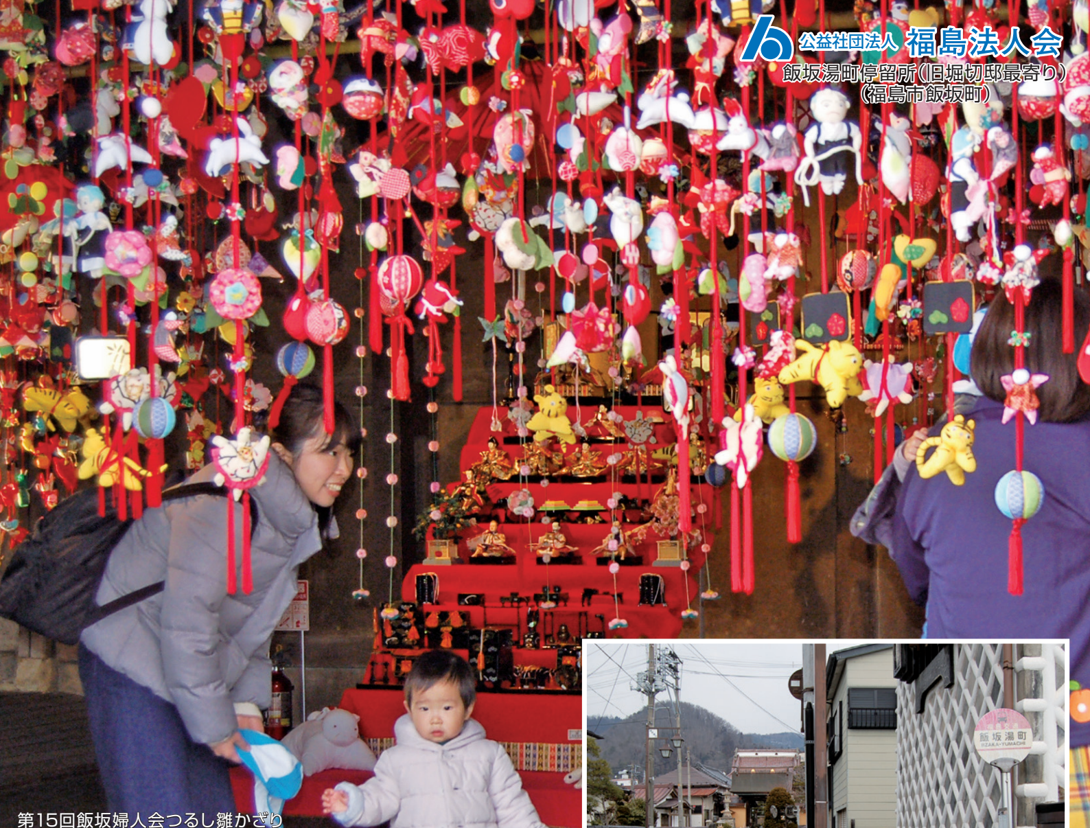
第15回飯坂婦人会つるし雛かざり