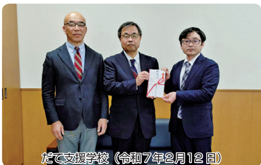
だて支援学校（令和7年2月12日）